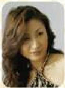
寺内 静 Shizuka Terauchi