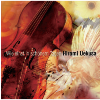
発売元:ディスククラシカ ジャパン DCJA-21020 2,381円+消費税