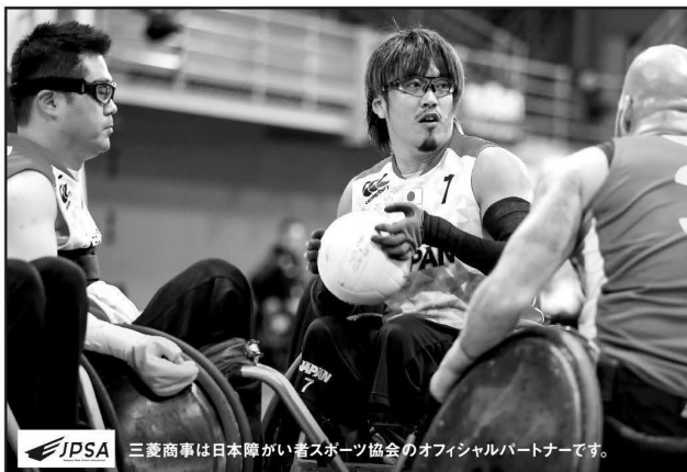
JPSA 三菱商事は日本障がい者スポーツ協会のオフィシャルパートナーです。

【主催】公益財団法人 日本製鉄文化財団 〒102-0094 東京都千代田区紀尾井町6番5号 紀尾井ホール内 TEL.03-5276-4500(代表) ホームページアドレス http://www.kioi-hall.or.jp