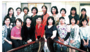
草加市レバーハープ・アンサンブル (レバーハープ)