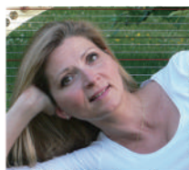
ペアトリス・ギエルマン [フランス] (ハープ)