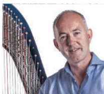
イオン・ジョーンズ [イギリス] (ハープ)