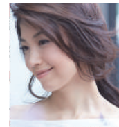
【19日 特別ゲスト】 村治佳織 (クラシックギター)