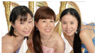
Café de la Harp (ハープ)