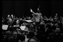
チェロ・オーケストラ

アヴェ・マリア 賛歌 メドレー 悲しきワルツ チェロの為のハーモニックファンファーレ