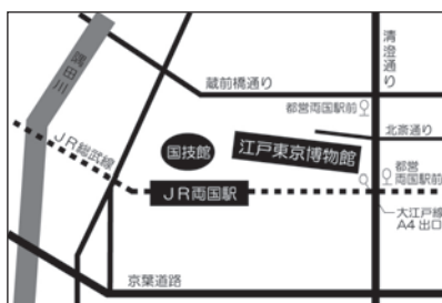
江戸東京博物館 アクセス ●JR総武線 両国駅西口下車 徒歩3分 ●都営地下鉄大江戸線 両国駅 A4出口 徒歩1分