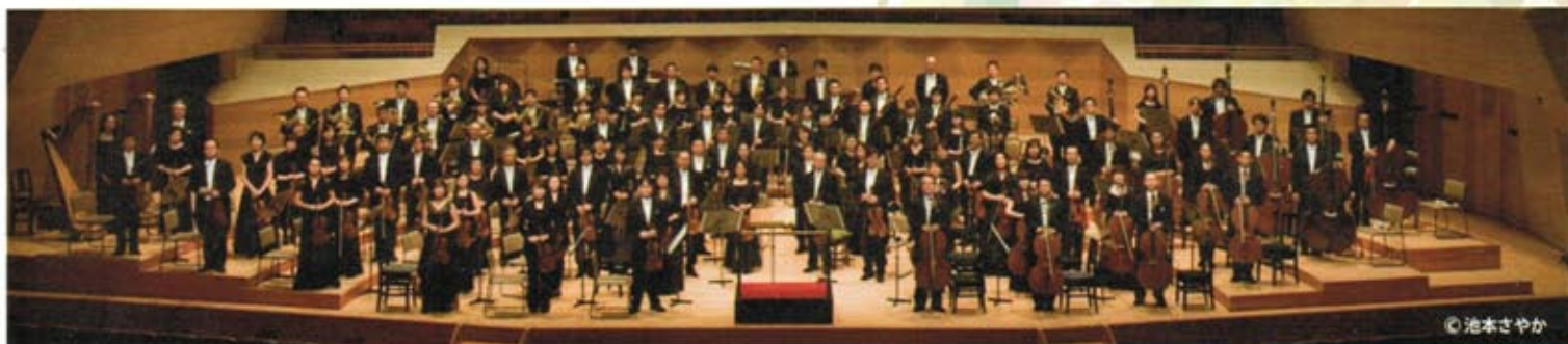
Tokyo Metropolitan Symphony Orchestra

チャイコフスキー：ロココの主題による変奏曲 イ長調 作品 33【原典版】 メンデルスゾーン：ヴァイオリン協奏曲 ホ短調 作品 64 ブラームス：交響曲第4番 ホ短調 作品 98